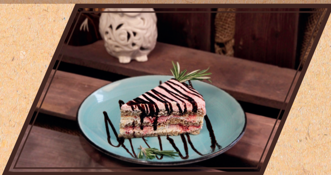
Торт «Зимние вечера» 120/20 г 210 руб.