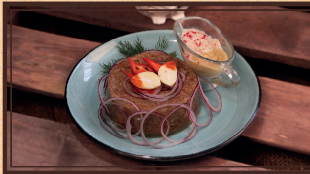
Холодец из лосося с хреном и горчицей 250/20/20 г 250 руб.