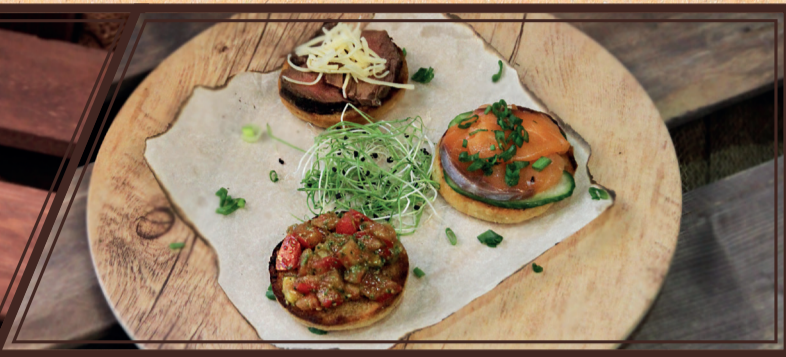
Трио брускетт: с томатами, лососем, ростбифом 65/60/65 г 300 руб.