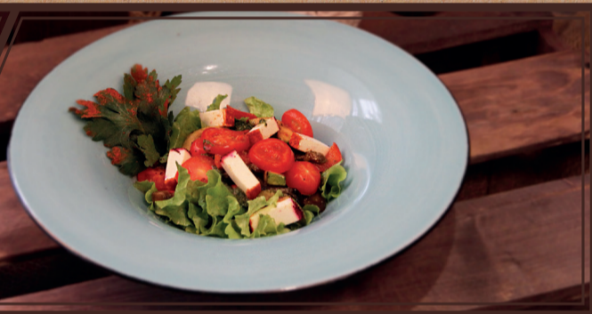
Салат из запеченных овощей с сыром фета и соусом песто 210 г 250 руб.