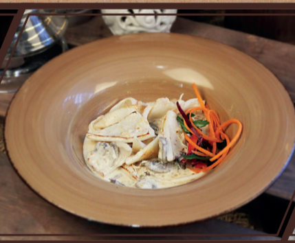
Кальмар под сливочно-грибным соусом 150/10 г 250 руб.