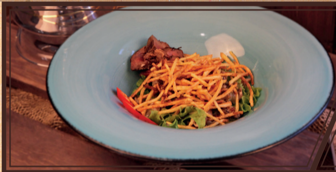
Салат с нежным ростбифом, опятами и маринованным огурцом 190 г 330 руб.