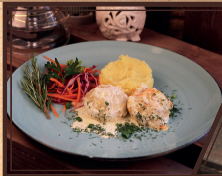
Томленные тефтели из нельмы с картофельным пюре 100/150/30 г 400 руб.