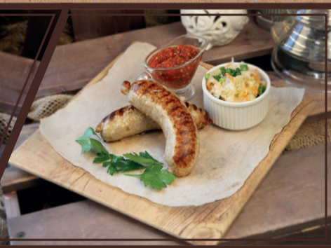
Мясные колбаски на гриле с кедровыми орешками 150/50/50 г 350 руб.